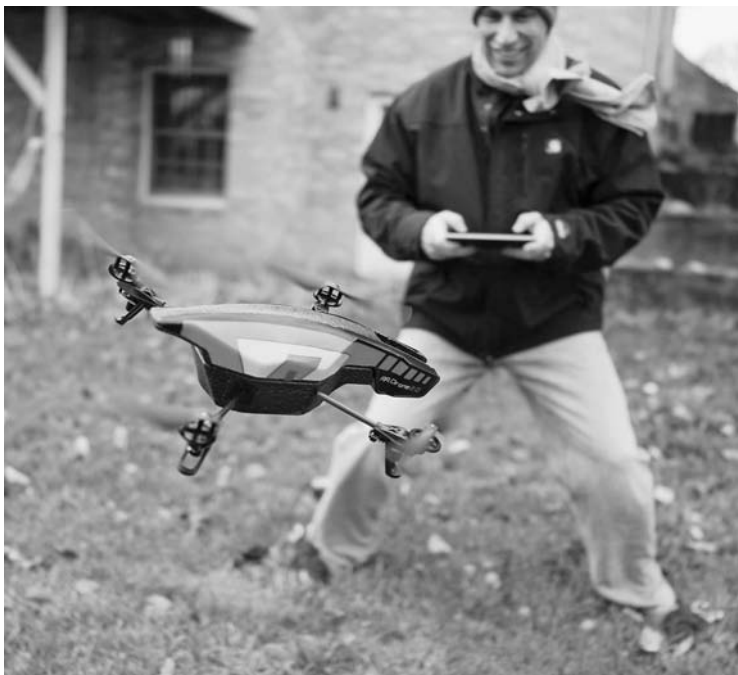
Rysunek 2.4. Dron Parrot AR Drone 2.0 wyposażony w kamerę