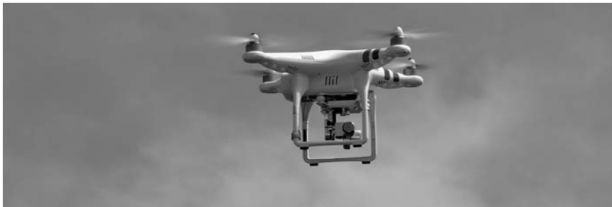
Rysunek 2.3. Dron DJI Phantom 2 Vision wyposażony w kamerę