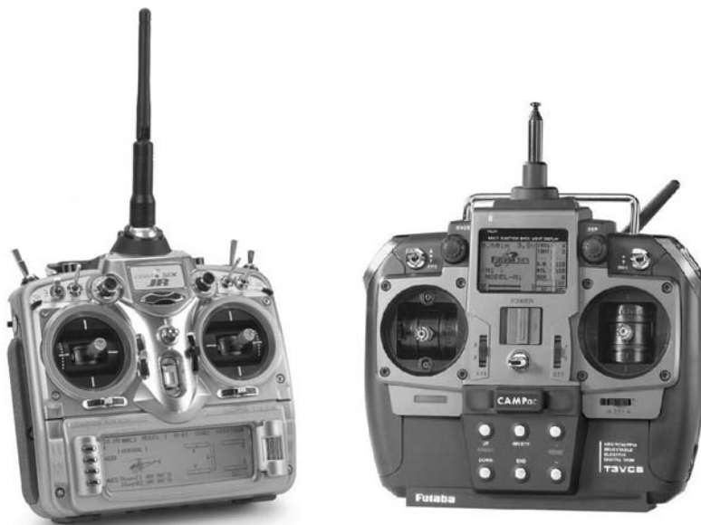
Rysunek 2.9. Nadajniki zdalnego sterowania

Do drona powinna być dołączona dokumentacja określająca współpracujące z nim nadajniki. Jeżeli nie możesz znaleźć tych informacji w instrukcji obsługi lub w internecie, to wstrzymaj się z zakupem nadajnika. Nadajnik niekompatybilny z Twoim dronem może tylko pełnić funkcję balastu lub dzieła sztuki współczesnej. Na rysunku 2.9 pokazano dwa nadajniki zdalnego sterowania, które mogą być używane do sterowania różnymi dronami.