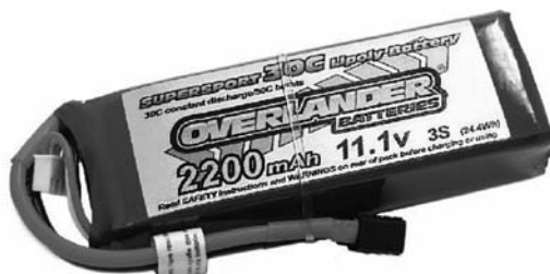
Rysunek 2.11. Dwa akumulatory LiPo (jeden z nich jest markowy, a drugi jest zamiennikiem)