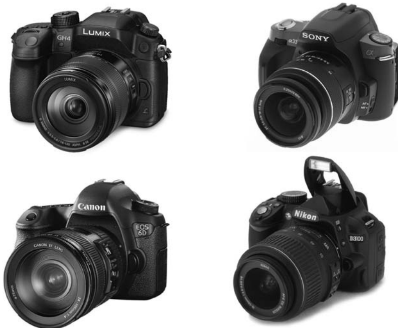
Rysunek 2.7. Lustrzanki cyfrowe wraz z obiektywami