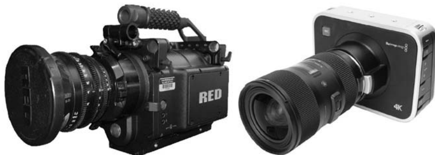
Rysunek 2.8. Popularne kamery rejestrujące obraz o jakości kinowej