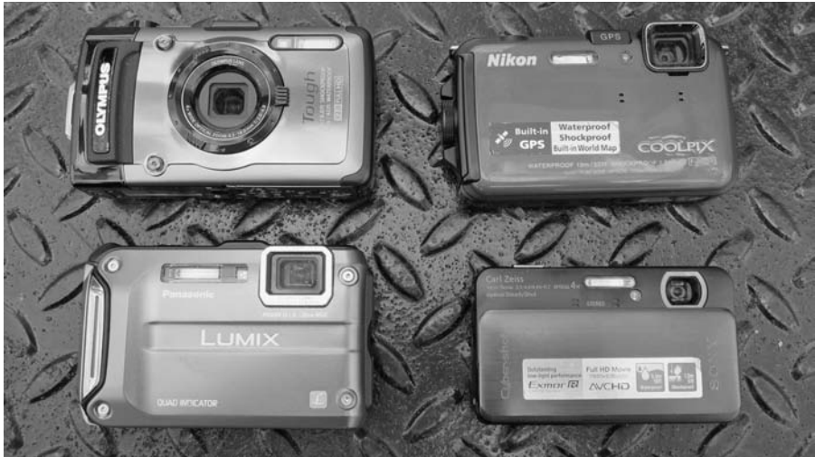
Rysunek 2.6. Aparaty kompaktowe wyglądają słodko

Aparaty kompaktowe to tania przepustka do świata wideo. Większość aparatów tego typu umożliwia rejestrowanie obrazu. Jeżeli dopiero zaczynasz interesować się filmowaniem, to jest to dobre rozwiązanie umożliwiające rozpoczęcie przygody z filmowaniem bez ponoszenia dużych kosztów. Obraz w stosunku do ceny i dostępnych funkcji jest fantastyczny, ale nie zaspokoi on potrzeb doświadczonego fotografa. Na rysunku 2.6 pokazano kilka aparatów kompaktowych o małych i średnich rozmiarach.