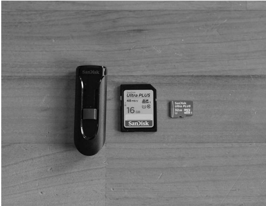
Rysunek 2.2. Różne nośniki pamięci stosowane w dronach