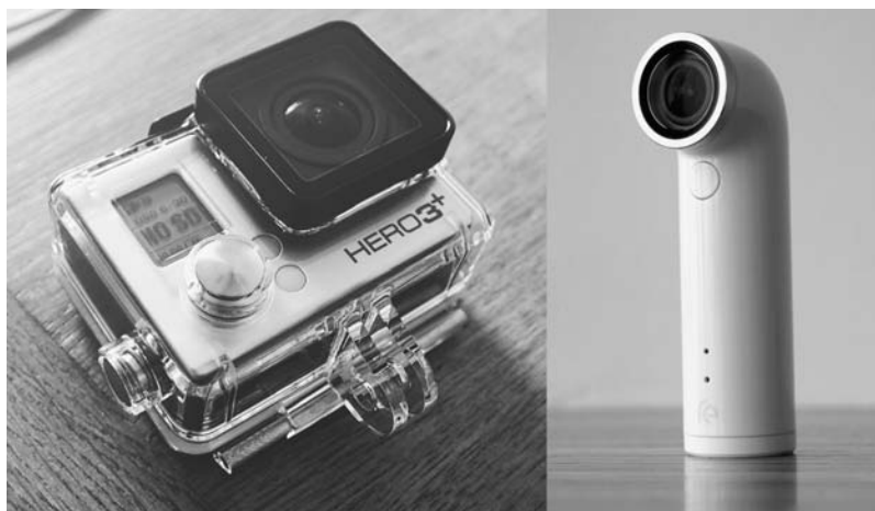
Rysunek 2.5. Dwa modele kamer sportowych

Innymi graczami na rynku GoPro... — chodzi mi o rynek kamer sportowych — są Sony, JVC i Garmin, ale produkty wszystkich tych firm pozostają daleko w tyle za GoPro. Na rysunku 2.5 pokazano dwa modele kamer sportowych.