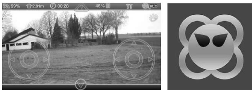
Rysunek 2.10. Przykładowa aplikacja sterująca dronem i jej logo

Do niektórych dronów dołączane są radiowe urządzenie zdalnego sterowania oraz mobilna aplikacja umożliwiająca podgląd położenia drona (współrzędnych GPS), a także statystyk lotu takich jak prędkość, poziom akumulatora i czas trwania lotu. Na rysunku 2.10 przedstawiono wygląd interfejsu przykładowej aplikacji umożliwiającej sterowanie dronem i jej logo.